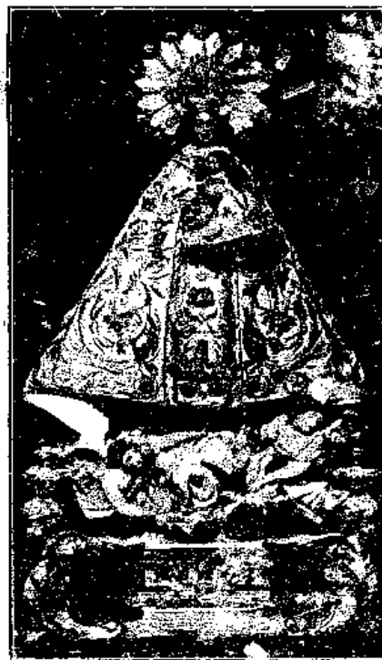
Nuestra Señora de Gracia