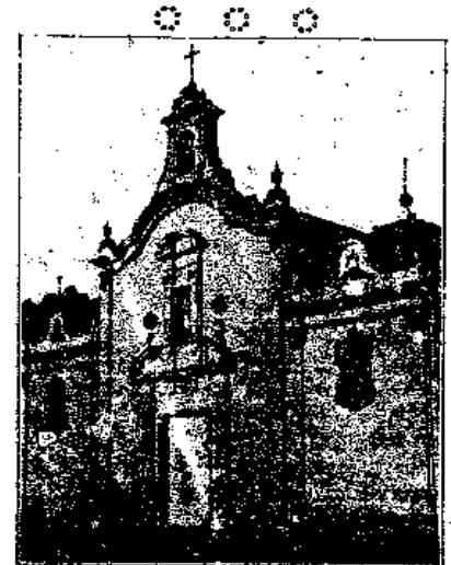
Vista del ex convento de Frailes Franciscanas

Vayan enhorabuena los tiempos de guerras y conquistas y sólo pensemos en la felicidad de este glorioso pueblo.