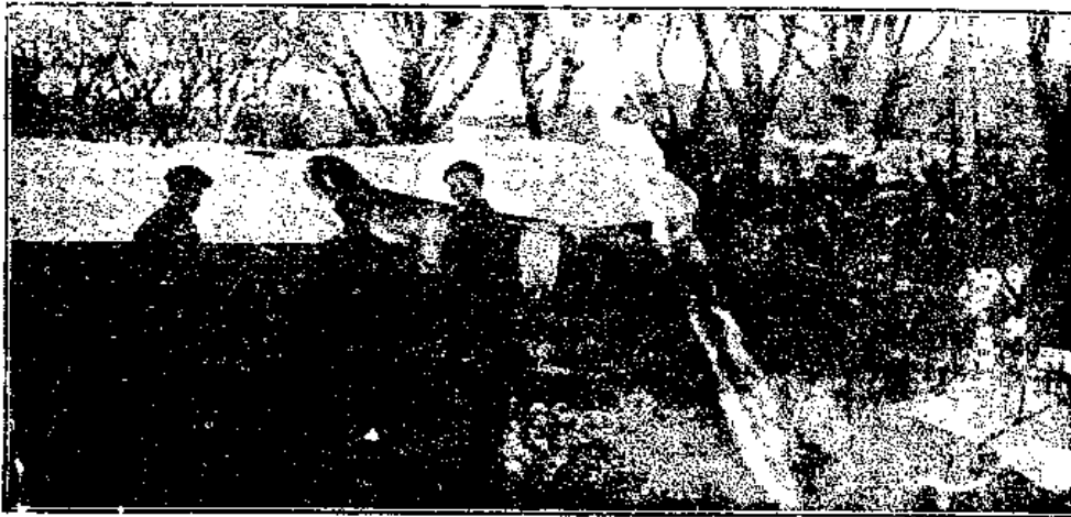
Esta fotografía fue tomada en San Sebastián en Febrero último. En números próximos (D. M.) publicaremos fotografías de algunos vuelos realizados por ese intrépido aviador.