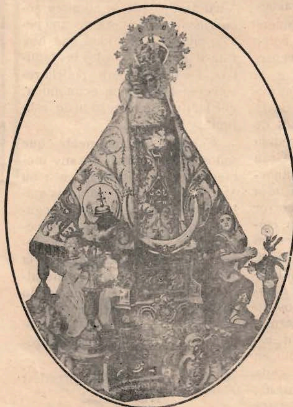
NUESTRA SEÑORA DE LAS VIRTUDES, EXCELSA PATRONA DE LA CIUDAD DE VILLENA.

lazo de unión entre todos, para que, avivando el entusiasmo, lleguemos a las Bodas de Plata con Villena toda, y sea ese día fiesta de amor y solemnísimo Acto de Reparación que nuestra Ciudad le ofrezca, y ojalá en él nos hiciéramos todos el firme propósito de rehacer pronto lo que se deshizo, para que otra vez quede Villena sin deudas ante la Madre Adorada, cuya bendición le pedimos desde este primer número en Salve que en silencio cariñoso va desde nuestro corazón hasta Ella.