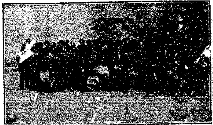
Un grupo de los asistentes al banquete, celebrado el Día del Antiguo Alumno