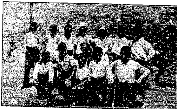
LEVANTE - VENCEDOR DE LA SEGUNDA CATEGORIA

El juego fué algo duro pero no pasó los límites de la deportividad.