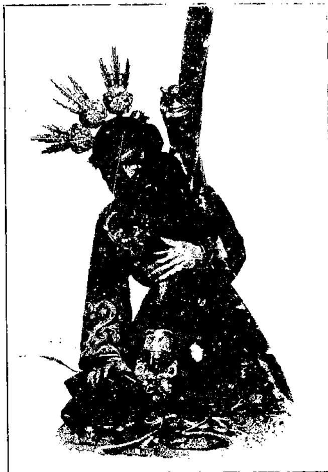
IMAGEN DE JESUS

que se venera en la Parroquia de San Lorenzo, de Sevilla