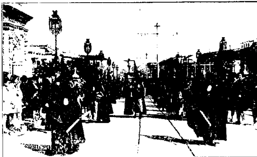
PROCESION EN SEVILLA Cofradía de la Parroquia de San Bernardo

¡VIERNES SANTO! ¡SEVILLA! Qué sublime encanto y cuán rica tradición encierran estas palabras. La solemnidad de aquel, hermanadas con la poesía de esta.